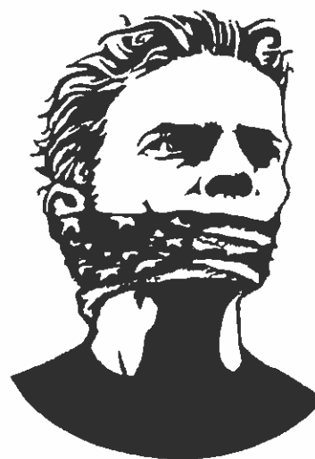
liberta di parola, Art. 19